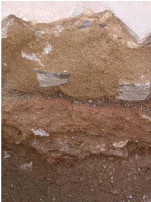
Fotografia núm. 12.

Rasa 200 (tram C) excavada fins a la cota màxima de profunditat, mirant al nord-est.