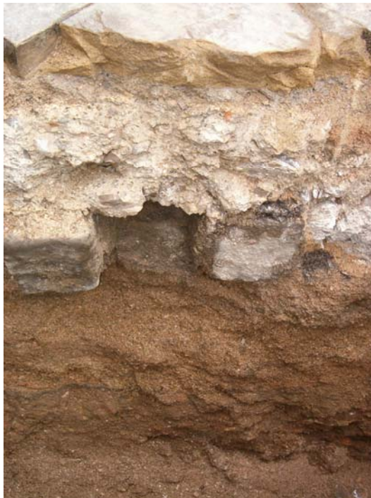
Fotografia núm. 14.

Rasa 300 excavada fins a la cota màxima de profunditat, mirant al nord-oest.