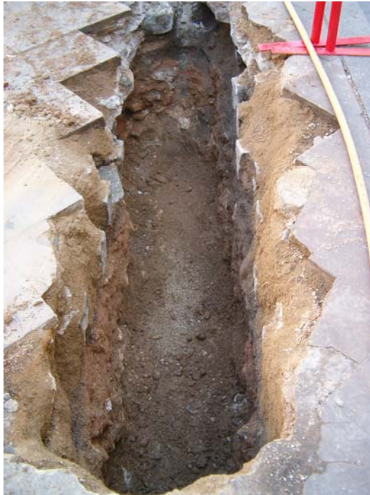
Fotografia núm. 11.

Rasa 200 (tram C) excavada fins a la cota màxima de profunditat, mirant al nord-est.