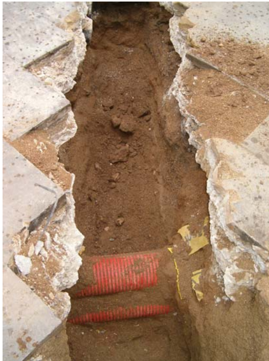
Fotografia núm. 13.

Rasa 300 excavada fins a la cota màxima de profunditat, mirant al nord-oest.