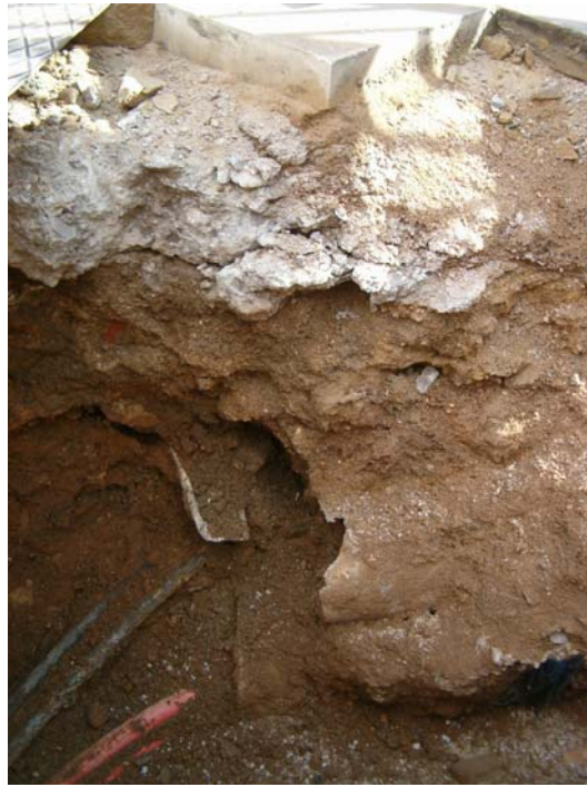
Fotografia núm. 9.

Tall estratigràfic de la rasa 200 (tram A) mirant al sud-est. S'hi poden observar les unitats 201, 202 i 203.