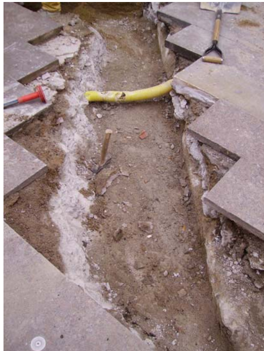
Fotografia núm. 10.

Tall estratigràfic de la rasa 200 (tram A) mirant al sud-est. S'hi poden observar les unitats 201, 202 i 203.